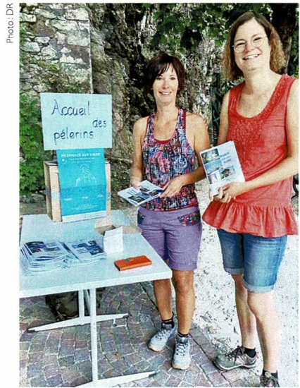
Accueil à Longeborgne.

Le curé de Savièse, FX, accueille avec enthousiasme la petite troupe, écrasée de chaleur mais fière du chemin parcouru. A la chapelle, deux témoignages de couples qui ont eu la grâce d'accueillir un enfant après un pèlerinage effectué aux trois Marie ont provoqué joie et émotions dans la chapelle au moment de la bénédiction des exvoto. Le saviez-vous ? Si le pèlerinage aux trois Marie a lieu officiellement le dimanche entre le 8 septembre (fête de la nativité de Marie) et le 15 septembre (mémoire de ND des Douleurs) il est pratiqué tout au long de l'année et il n'est pas rare de croiser sur le chemin des amies ou une personne seule, faisant avec espérance, foi et le cœur apaisé le parcours qui relie ND de Compassion, ND des Sept Joies et ND des Corbelins.