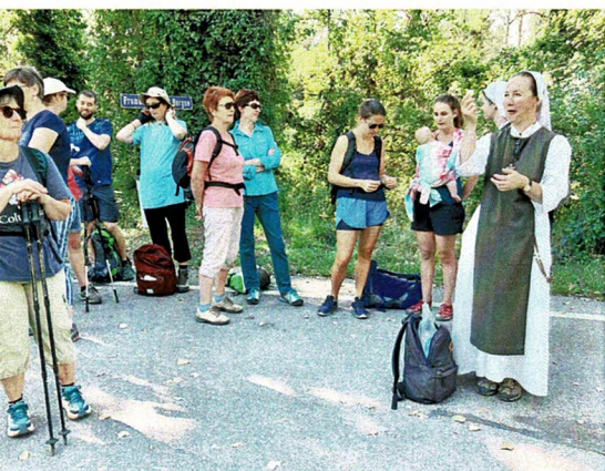
Petite pause dans les bois de la Borgne.